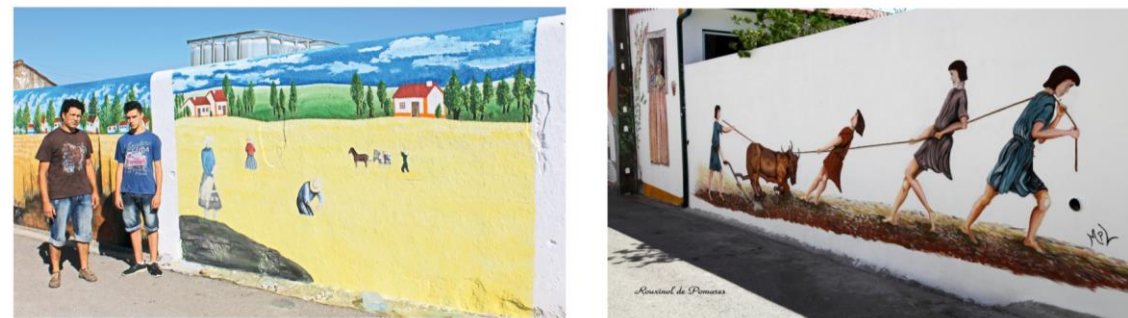
Fachadas e muros de Riachos transformados em telas

Pinturas murais decoram a vila por altura de mais uma Festa da Bênção do Gado. A iniciativa nasceu em 2012 com o Núcleo de Arte de Riachos e conta com a colaboração da Comissão de Festas e da População local (Fotos: Jornal "O Mirante" de 14.7.2016)